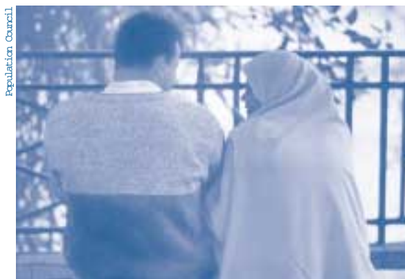
Síntesis de: Cómo satisfacer las necesidades de atención a la salud de la mujer después de un aborto. Dale Huntington. Documento de programa, núm. 1, México, D.F.: Population Council/FRONTERAS, Marzo 2001.