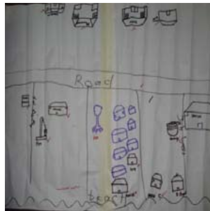
Utilisation de la cartographie participative, les filles ont identifié les espaces sûrs et dangereux dans leur communauté.

Les discussions communautaires ont révélé que la présence des représentants communautaires était nécessaire pour servir de lien entre les tutrices du programme et l'ensemble de la communauté. L'équipe du programme a établi le rôle des mères de la communauté et a choisi quatre femmes qui inspirent le respect des filles et des autres membres de la communauté. Les mères communautaires sont responsables de la médiation des problèmes potentiels pouvant résulter de la partici-