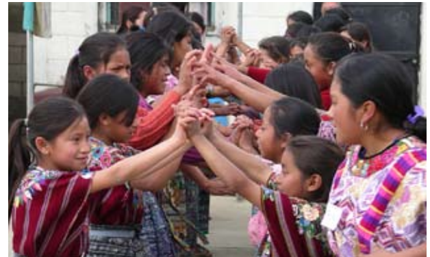
El programa Abriendo Oportunidades crea espacios seguros para las niñas mayas y les brinda mentores.

El enfoque del Population Council en los adolescentes comenzó a principios de 1990 y estuvo acompañado del compromiso de hacer que el ámbito de la investigación y los programas para adolescentes cambie de un enfoque en la sexualidad, la salud reproductiva y el comportamiento a uno que contemple los problemas sociales y económicos más amplios que constituyen la base de la salud y el bienestar de los adolescentes.