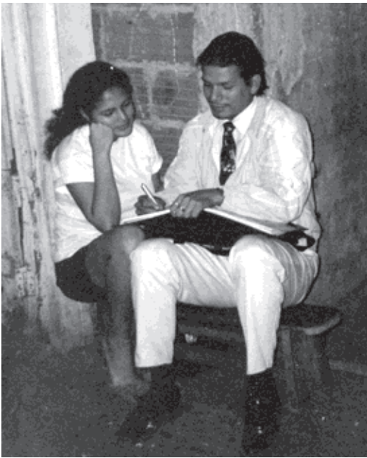
Le soutien entre pairs, Association Siempre Vida Guayaquil, Equateur.

Au Burkina Faso, en Inde et en Zambie, les services de counseling et dépistage volontaire ne sont pas suffisamment disponibles et seules les PVVIH qui ont de l'argent ou des contacts internationaux ont accès aux antirétroviraux. En Equateur, les ARV sont disponibles pour ceux ayant accès aux hôpitaux militaires, et dans une seule région pour les personnes couvertes par la sécurité sociale. L'accès au traitement des infections opportunistes est particulièrement difficile et problématique au Burkina Faso, en Inde et dans les zones rurales en Zambie.