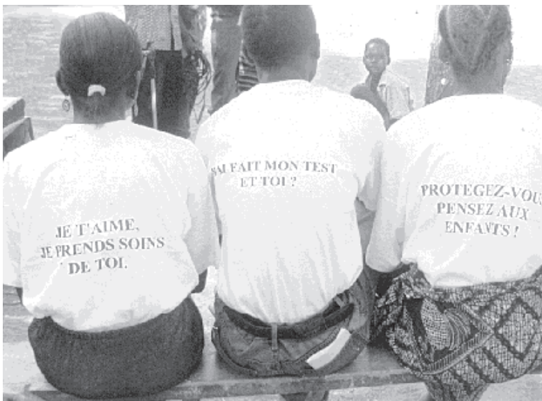
Les membres de REVS+ au Burkina Faso portent des T-shirts avec des messages de prévention lors d'une campagne de sensibilisation sur le VIH/SIDA.

La participation accrue des PVVIH a été observée dans des organisations qui ont pour vocation de défendre les droits des personnes